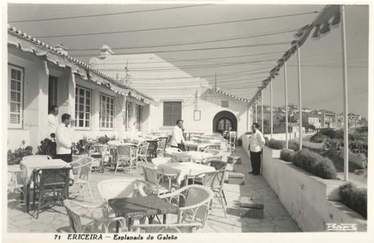
71 ERICEIRA - Esplanada do Galeão

Não sou desses tempos, mas “conheço” o Galeão!