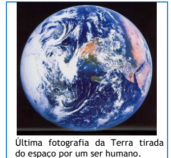
Última fotografia da Terra tirada do espaço por um ser humano.

A queima do equivalente de uma tonelada de carvão representa a emissão de três toneladas de Dióxido de Carbono (CO 2 ), para a atmosfera. Se submetermos a totalidade da nossa floresta a este “tratamento” veremos que este processo não é, afinal, assim tão bom. Mas se em vez de queimarmos, fizermos a limpeza da floresta com os cuidados acima referidos, e aproveitarmos o combustível, daí resultante, para a alimentação das Centrais de Biomassa - em fase de grande implantação no território nacional - estaremos a produzir energia sem, praticamente, emissão de gases com efeito de estufa.