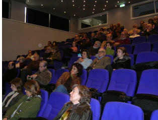
Um aspecto da assistência