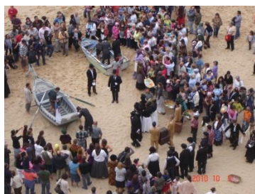
Reconstituição de 5 Outubro