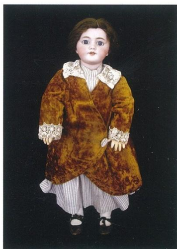
Exposição de Brinquedos